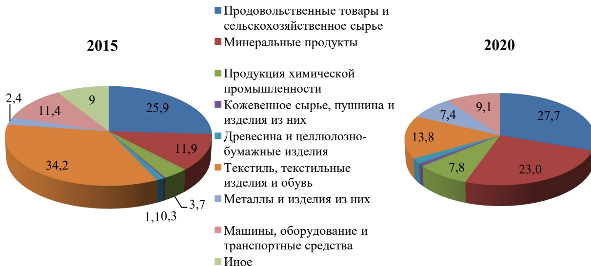
Рис. 2. Структура экспорта по укрупненным товарным группам в 2015 и 2020 гг., %