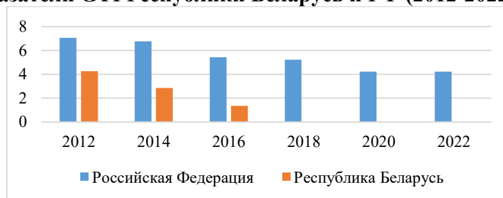
Показатели GTI Республики Беларусь и РФ (2012-2022 гг.) 27