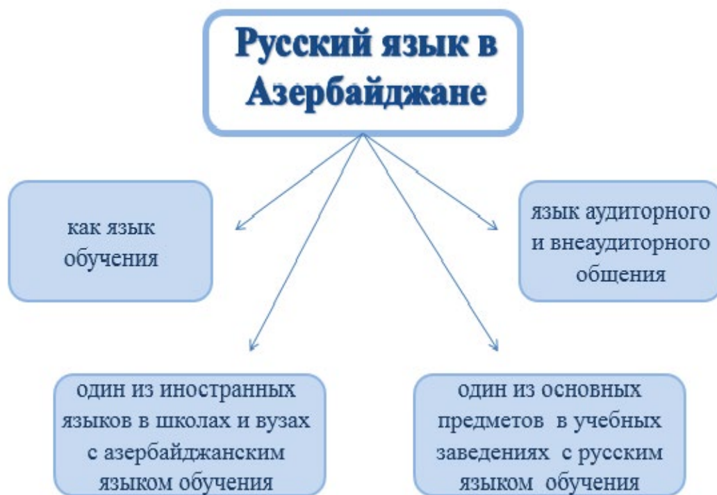
Схема 1. Употребление русского языка в Азербайджане.

Для развития русского языка в стране органы власти Азербайджана создают условия для создания целой сети «научных и научно-методических объединений и официальных изданий научно-методической литературы. Одними из основных вузов по обучению на русском языке являются Бакинский славянский университет, филиал Московского государственного университета имени М.В. Ломоносова, Бакинский государственный университет и филиал Московского государственного медицинского университета имени И.М. Сеченова. Факультеты русского языка и литературы также открылись в университетах Нахчывана, Гянджи и других городах Азербайджана.