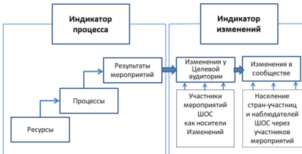
Рисунок 1 – Взаимосвязь индикаторов процесса и изменений в международной проектной деятельности

Непосредственно мероприятия, проводимые в рамках деятельности международных организаций, в том числе таких организаций сотрудничества, как ШОС, целесообразно оценивать, как индикаторами процесса, так и индикаторами изменений. Сам процесс приводит к определенным изменениям сначала у участников мероприятий, проводимых этими организациями, а в конечном итоге, такая деятельность нацелена на заданные проектом изменения в сообществе, см. рис. 1.