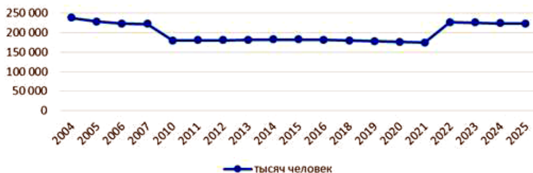
Рис. 1. Численность представителей немецкого этноса в РК в 2004–2025 гг.

На рис. 1 представлена диаграмма количества немецкого населения в РК по годам: в 2004 г. – 237 643 человек немецкого этноса в РК, в 2005 г. – 228 123 человек, в 2006 г. – 222 711 человек, в 2007 г. – 222 296 человек, в 2010 г. – 179 408 человек, в 2011 г. – 180 423 человек, в 2012 г. – 180 898 человек, в 2013 г. – 181 379 человек, в 2014 г. – 181 941 человек, в 2015 г. – 181 948 человек, в 2016 г. – 181 767 человек, в 2018 г. – 179 476 человек, в 2019 г. – 178 029 человек, в 2020 г. – 176 107 человек, в 2021 г. – 174 632 человек, в 2022 г. – 226 804 человек, в 2023 г. – 225 353 человек, в 2024 г. – 224 353 человек, в 2025 г. – 223 272 человек.