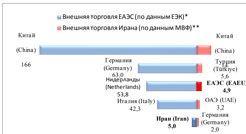
Рис. 2. Место Ирана и ЕАЭС в общей торговле по итогам 2021 г., млрд долл.