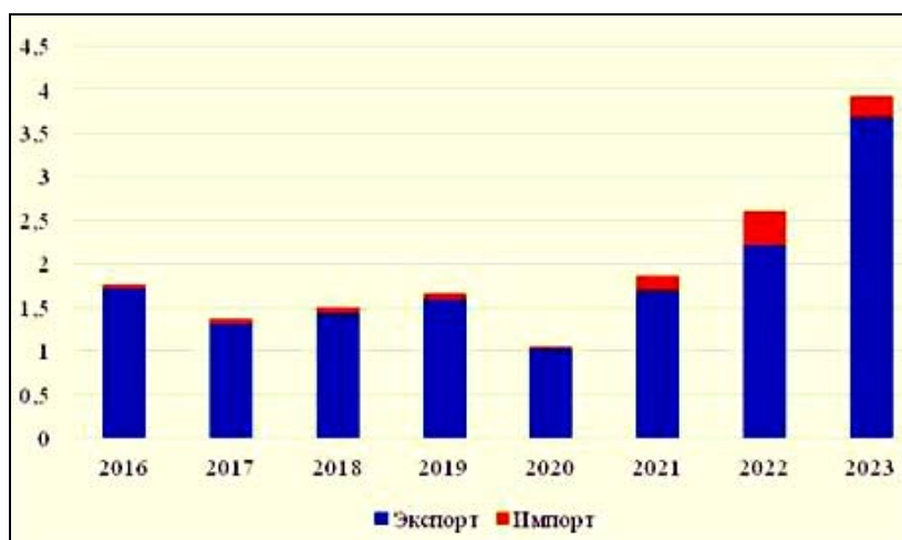
Рис. 1. Товарооборот между КНР и Республикой Таджикистан в период 2016–2023 гг., млрд долл. США

Экономическое сотрудничество. Объем двусторонней торговли между Китаем и Таджикистаном уверенно возрастает с 2020 г., когда наблюдалось проседание товарооборота на 36,5% в связи с началом пандемии