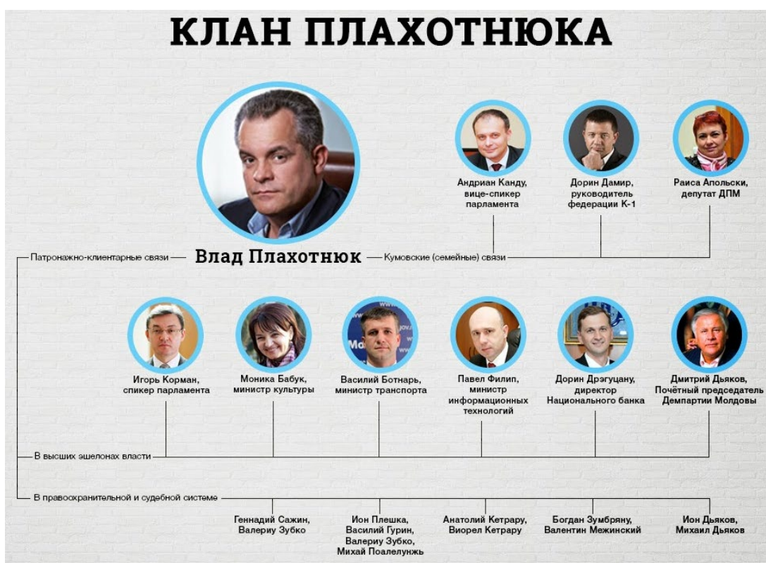
Рисунок 2. Клан Плахотнюка 2 .