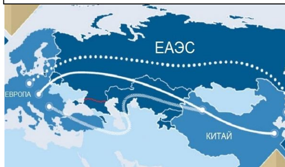
Карта транспортной и торговой сети в рамках евразийского сотрудничества.

В вопросе сближения Турции, России и Ирана на базе евразийской идентичности или интеграции, данный аналитический центр весьма категоричен: «Сотрудничество Турции с Россией или Ираном в этом отношении носит чисто рациональный характер, основывается на проблемах и уважает сферы национального суверенитета, а не представляет собой «романтическое» или идеологическое единство. Проще говоря, Турция категорически не выходит из западного альянса и не входит в режим евразийского альянса. Анкара справедливо следует прагматичной, гибкой и адаптивной линии внешней политики в сочетании с быстро меняющейся региональной динамикой. Заинтересованным экспертам во внешней политике настоятельно рекомендуется отказаться от аргументов анахронического сдвига оси от Запада в сторону Востока...» 5 .